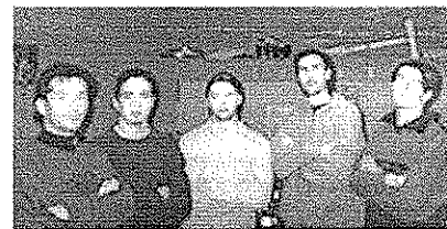
Invece qui fanno i seri... (la foto in sala prove fa sempre molto "serio")